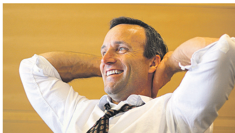
Die Implantation eines Stents ist schnell überstanden.